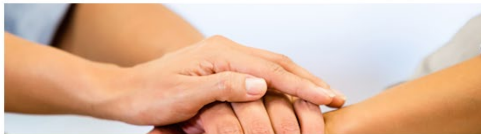
Coopératives de travailleurs