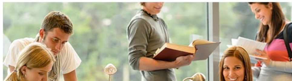
Cooperatives avec plusieurs parties pren...