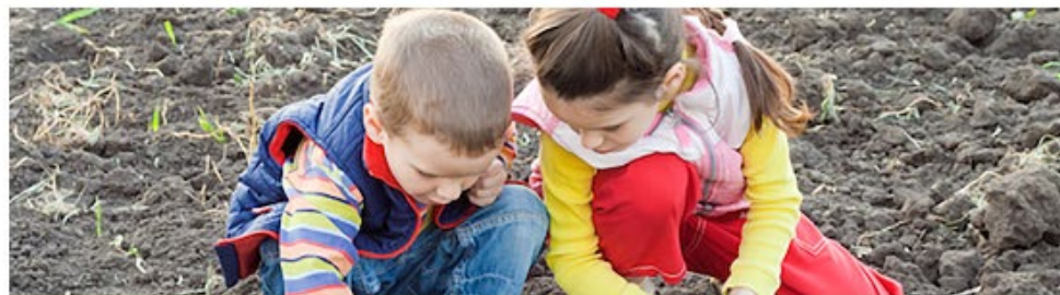
Coopératives de consommateurs